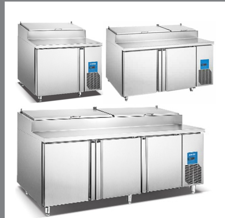
MODELOS PICL1 | PICL2 | PICL3

MAQUINARIA INTERNACIONAL GASTRONÓMICA, S.A. DE C.V. 📍 HENRY FORD 257-H, COL. BONDOJITO, ALC. G.A.M. 07850, CDMX. ☎ 5517.4771 | 5739.3423